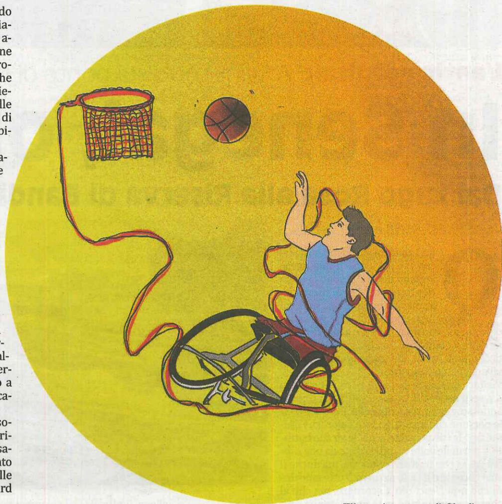
[Illustrazione a cura di Claudia Tuzi, giovane impegnata nel mondo del volontariato]

Quindi basta leggere e sentire l'espressione "diversamente abile" ma sempre e solo persone con disabilità.